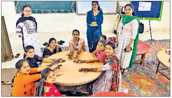
भवानीखेड़ा। बीके विद्यालय में आयोजित कार्यक्रम में उपस्थितजन।