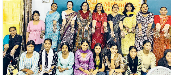
भिवानी। मेहंदी प्रतियोगिता में भाग लेते प्रतिभागी।