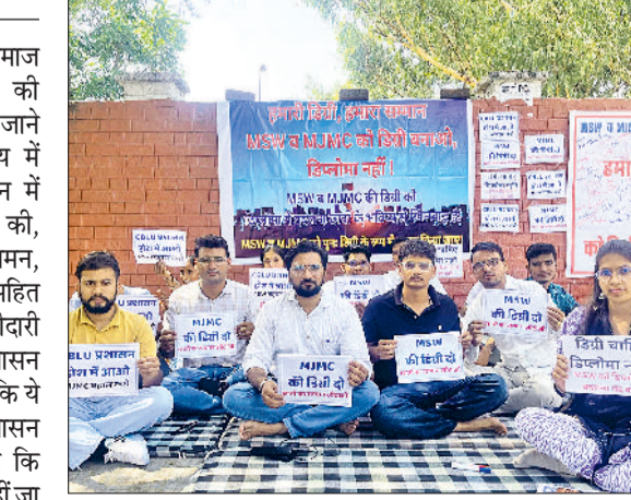
भिवानी। सीबीएल्यू में घरने के दौरान विरोध जताते विद्यार्थी।