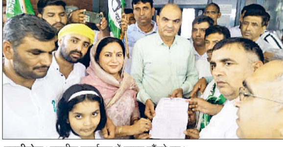
भवानीखेड़ा। तहसील कार्यालय में ज्ञापन सौंपते हुए।