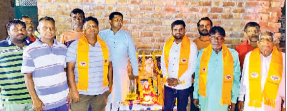
भिवानी। देवसर गांव में महर्षि वाल्मीकि के चित्र पर पुष्प अर्पित करते हुए।