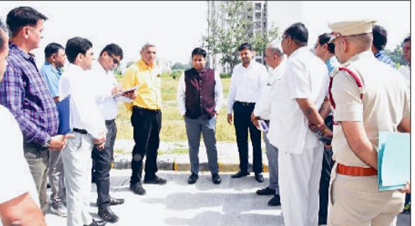
भिवानी। मेडिकल कॉलेज का निरीक्षण करते उपायुक्त।

इसी प्रकार से डीसी ने नगर परिषद कार्यकारी अधिकारी को घास की कटाई व स्फार्ड व्यवस्था दुरुस्त करने के निर्देश दिए ताकि पंडाल लगाने में किसी प्रकार की दिक्कत ना आए। उन्होंने कहा कि समारोह में शामिल होने वाले लोगों के लिए उचित वाहन पार्किंग की व्यवस्था की जाए, ताकि वाहनों से जाम की स्थिति ना बने। उन्होंने कहा कि लोक निर्माण विभाग, एनएच के साथ-साथ चिकित्सा शिक्षा अधिकारियों को निर्देश दिए कि मेडिकल कॉलेज के नव निर्मित भवन के आसपास क्षेत्र को सही ढंग से दुरुस्त किया जाए। मेडिकल कॉलेज की शोभा देखते ही बननी चाहिए।