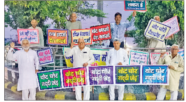
भिवानी। शहीद भगतसिंह चौक पर विरोध जताते संयुक्त किसान मोर्चा व युवा कल्याण संगठन के पदाधिकारी व सदस्य।