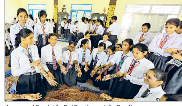
तोशाम। आयोजित मेहंदी प्रतियोगिता में भाग लेती प्रतिभागी।