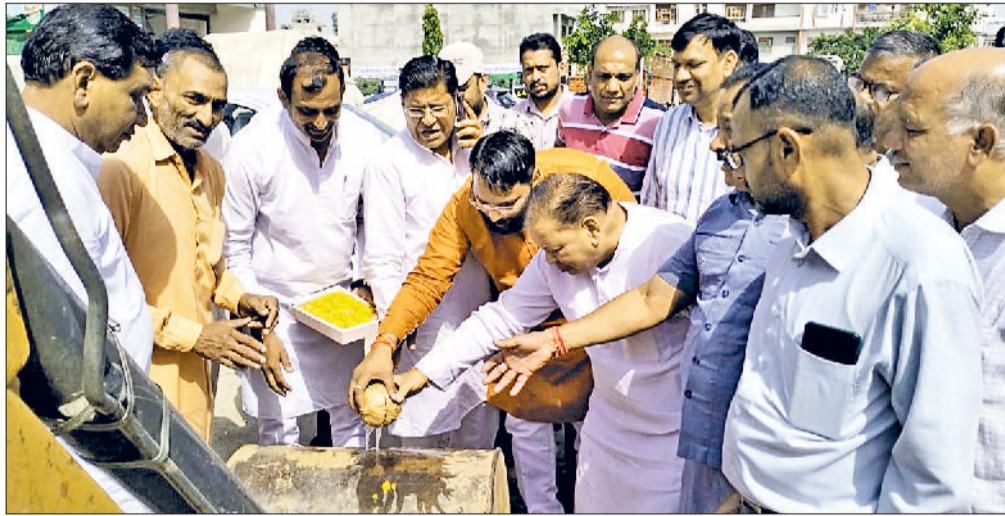
भिवानी। मंडी टाऊन सेंटर में नारियल फोड़कर निर्माण कार्यक्रम का शुभारंभ करवाते हुए।