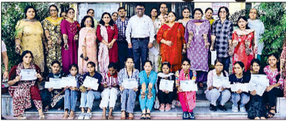
भिवानी। शिक्षकों के साथ प्रतिभागी छात्राएं।

राजीव गांधी राजकीय महिला महाविद्यालय में कॉलेज स्तर की मेहंदी प्रतियोगिता का आयोजन किया। प्रतियोगिता में छात्राओं ने भारतीय परंपरागत व आधुनिक मेहंदी डिजाइन के विभिन्न प्रकारों में अपनी प्रतिभा का प्रदर्शन किया। प्रतियोगिता में छात्राओं ने भारतीय मेहंदी, आधुनिक मेहंदी, ज्वेलरी मेहंदी, अरबी मेहंदी, टैटू मेहंदी, न्यूनतमवादी मेहंदी जैसी विभिन्न श्रेणियों में भाग लिया। आयोजकों ने बताया कि प्रत्येक श्रेणी में विजेता छात्राओं को पुरस्कार राशि और